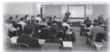
グローバル広報セミナー (於: 日本貿易会) 『海外派遣者ハンドブック フィリピン編』発行