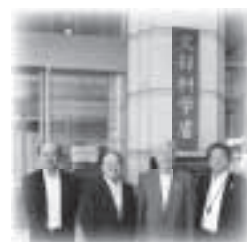
要望書提出 (海外子女教育)