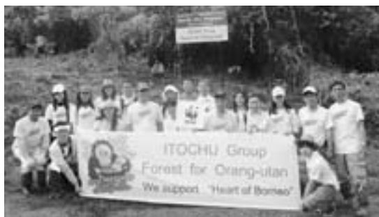
植林に参加したボランティアの皆さん

2009 年 10 月、WWF がイニシアチブをとり、インドネシア、マレーシア、ブルネイ政府が協力し、「ハート・オブ・ボルネオの森林生態系と緑の回廊の機能回復」を目的としたプロジェクトが