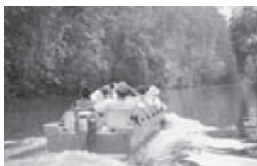
ボートで野生動物の観察へ