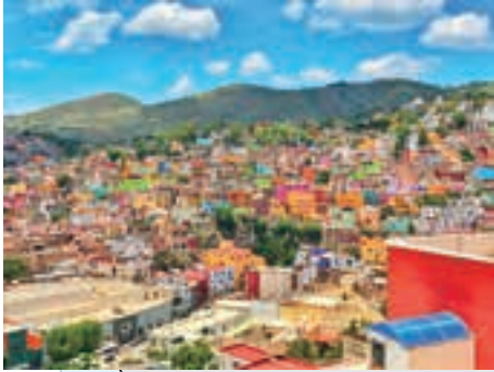
グアナファト(メキシコ)