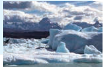
パタゴニアの氷河(チリ・アルゼンチン)