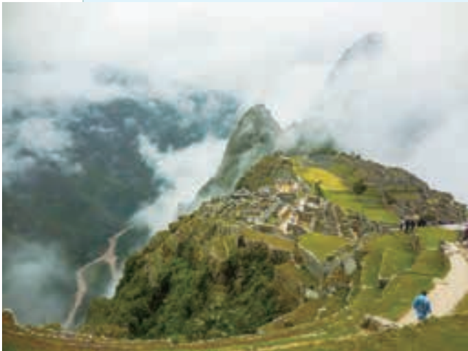
マチュピチュ(ペルー)