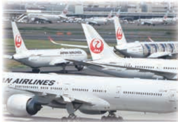
減便で駐機中の JAL 機 (5月11日、羽田空港)