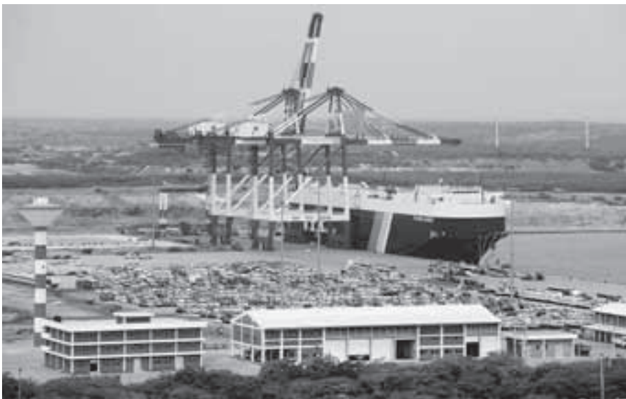
中国によって建設されたハンバントタ港 (スリランカ)