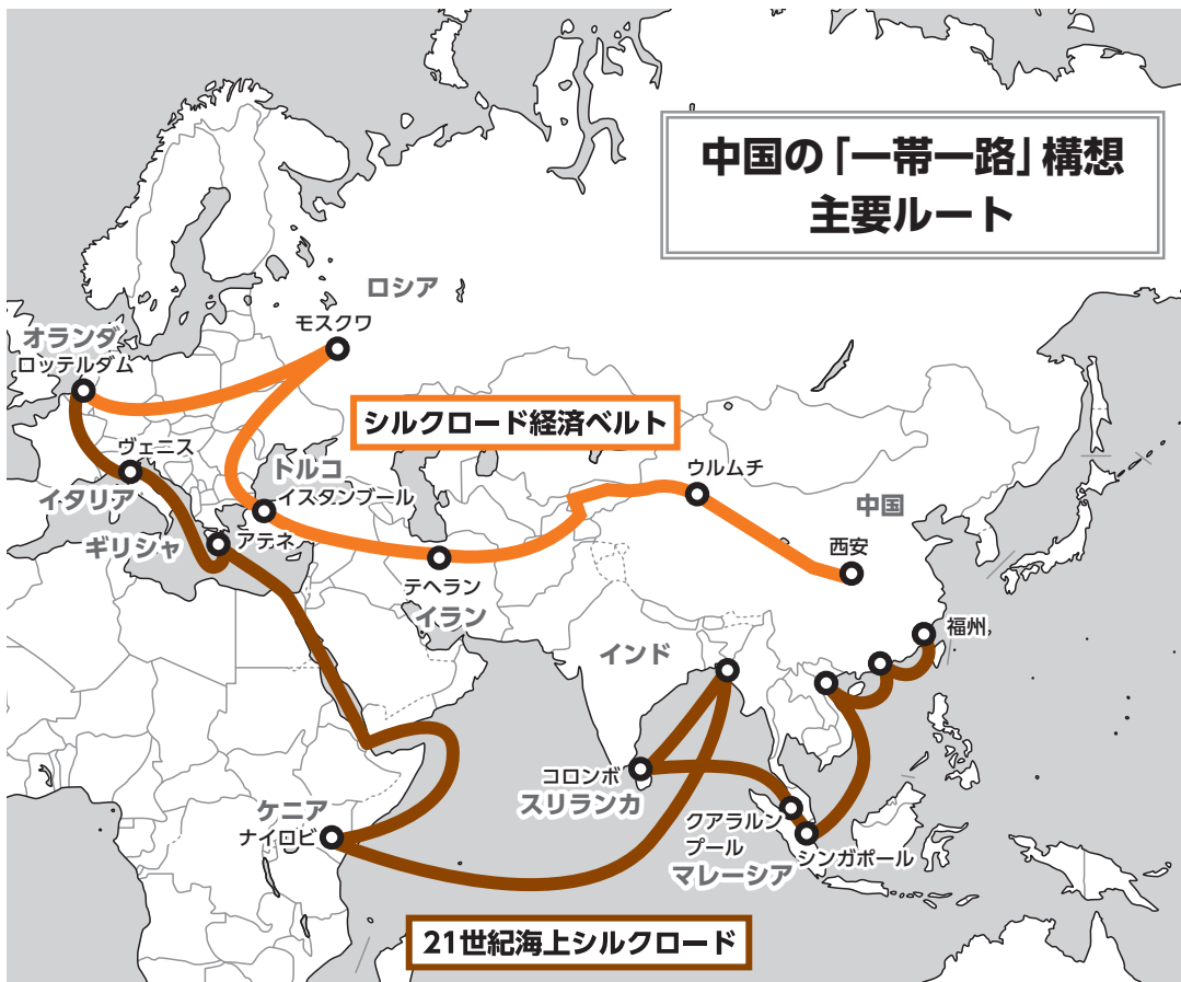
各種資料を基に日外協作成